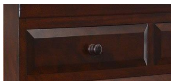
※抽斗前板の面取加工